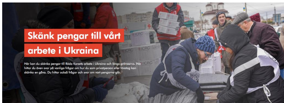
Från Svenska Röda Korsets hemsida