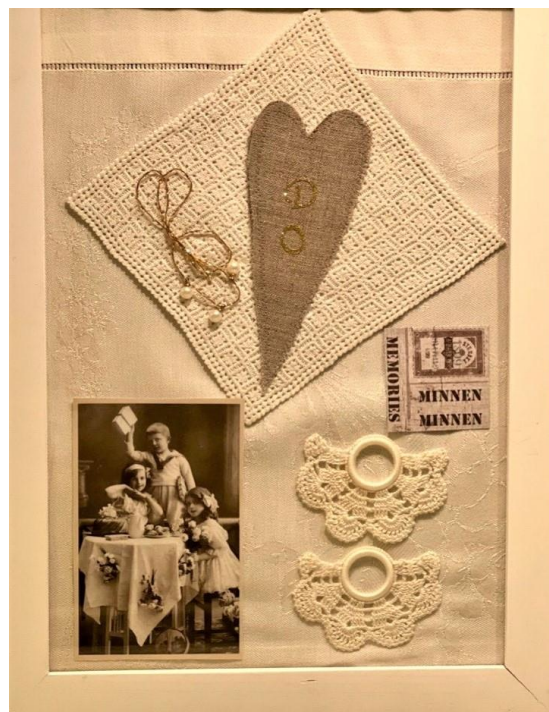
Good old days

Om någon är intresserad så hänger de kvar till den 3 juli med öppet fred- lörd- söndag mellan 12-16. Kulturhotellet Södergatan 15.