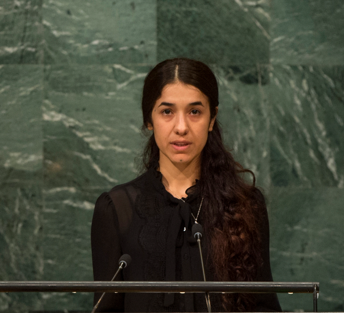
Nadia Murad, tal inför FN:s generalförsamling, september 2016.