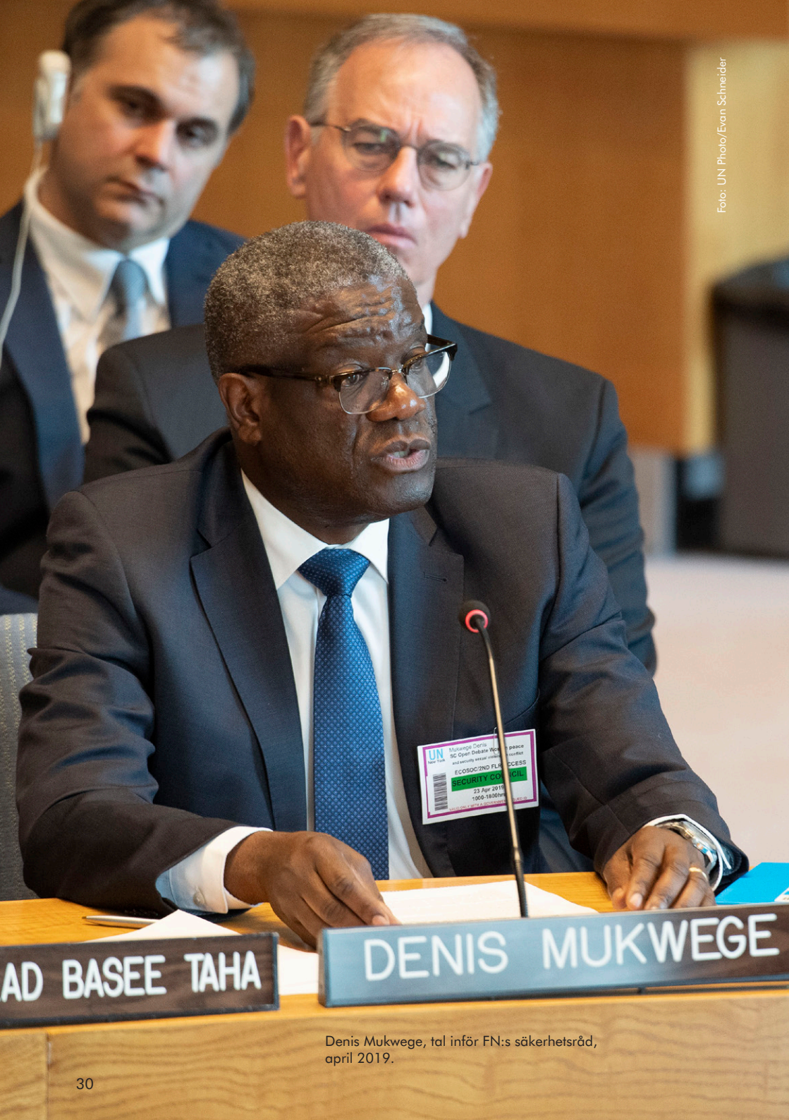
Denis Mukwege, tal inför FN:s säkerhetsråd, april 2019.