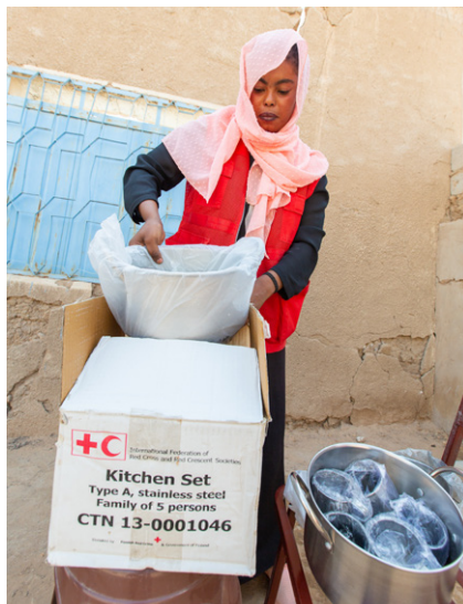
Volontär packar upp paket med köksredskap i Sudan.

Sverige har under året återkommande framhållit att det är nödvändigt att säkerställa humanitärt tillträde för att skydda liv, rättigheter och värdighet för offren i en väpnad konflikt, samt uppmanat involverade parter att tillåta och underlätta för humanitär hjälp-personal att verka i konfliktzoner. Den internationella humanitära sedvane-rättens förbud mot våldtäkter och andra former av sexuellt våld har liksom tidigare år också uppmärksammats under 2022. Sverige har även lyft det särskilda skyddet för barn i väpnade konflikter samt förbudet mot att anfälla sjukhus.